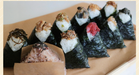
手づくりおむすび各種 110円