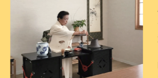
「海外の方は正座が苦手なので、座って茶湯を経験できるスペースをオリジナルで作りました。完全予約制ですが、会員は随時受け付けています」

大人も子どもも、自然に文化交流ができる場所をつくりたい 私たちは日仏文化交流の会に長年在籍しています。その縁もあり、荒川区の伝統工芸に携わる方々の