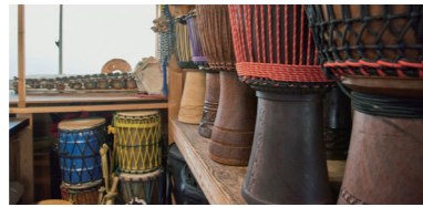
徒歩10分の場所にアフリカの楽器を扱う東京ジェンベファクトリー (写真下) も。はしご散歩がおすすめ。

「寒い季節に使ってみてください」と茂木さんがおすすめしてくれたのは、マリ産はちみつ (2,700円) と、シアバター (缶・2,000円、ボトル・3,000円)。