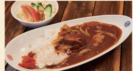
自家製ハヤシライス 800円