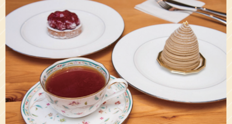
ケーキセット 1,230円~ (ケーキ1種類、お茶2杯)